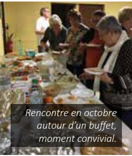
Rencontre en octobre autour d'un buffet, moment convivial.